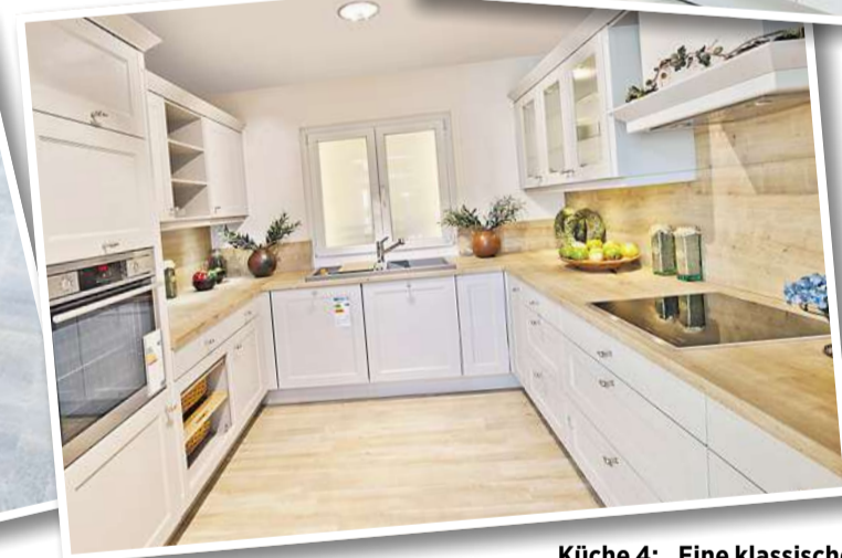
Küche 4: „Eine klassische Landhausküche in dem neuen Farbton sandgrau. Aus meiner Sicht bietet sie eine tolle aufgelockerte Planung auf kleinem Raum.“