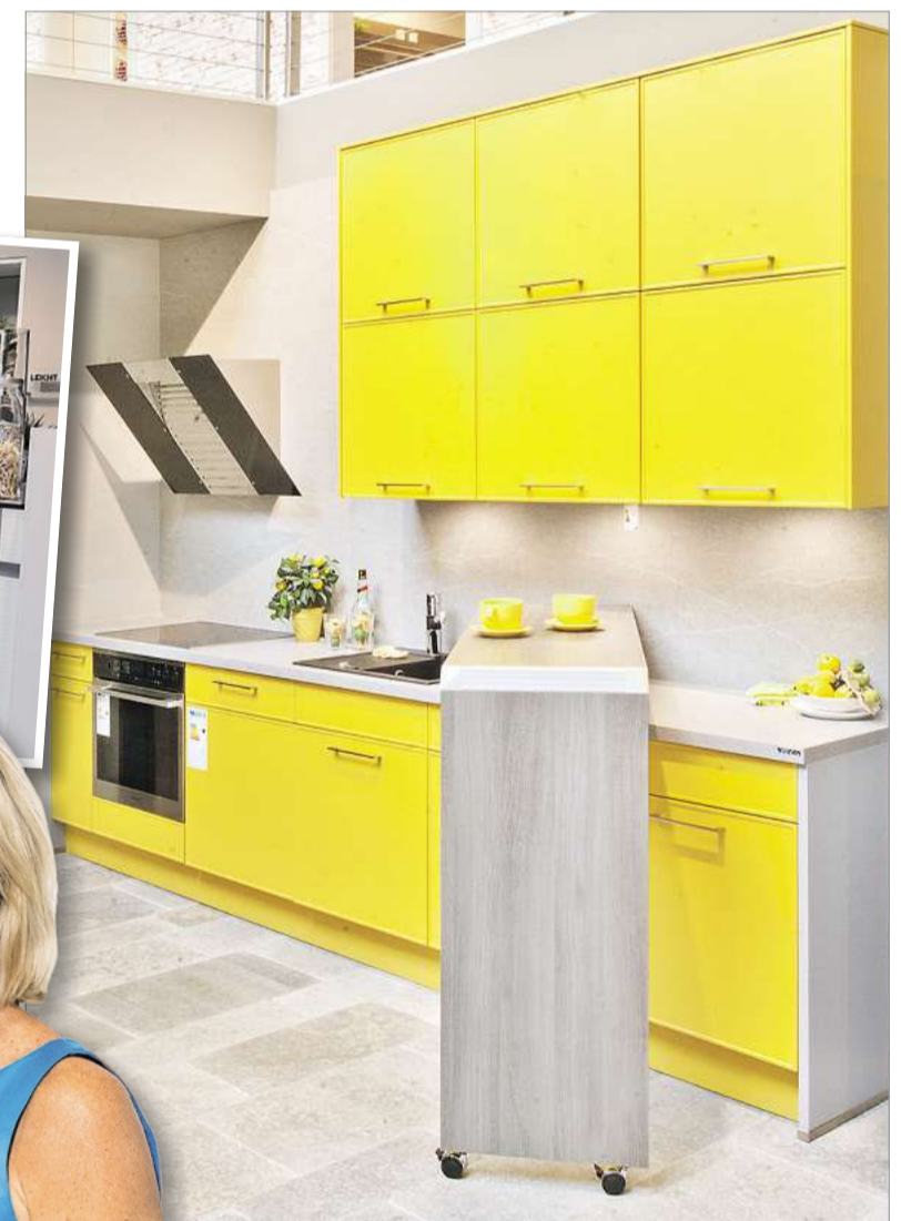
Küche 5: „Eine kleine Zeile mit viel Stauraum und einem Tresen – und alles andere als langweilig.“