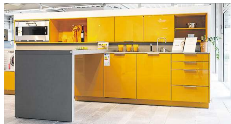
Küche 1: „Eine tolle kleine Lackküche in der Trendfarbe Kurkuma mit Keramikarbeitsplatte. Nur eine Zeile – und trotzdem eine Sitzzeile und die Kochzone in den Raum führend.“

Unternehmenschefin stellt fünf der zum Verkauf stehenden Musterküchen vor